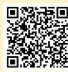
「ラーケーションの日」活動例