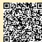
「ラーケーションの日」ポータルサイト

※ 県の Web ページ「ラーケーションの日」ポータルサイトには、計画づくりに活用できる「ラーケーションカード」や、いろいろな学びができる場所を紹介しています。参考にしてください。